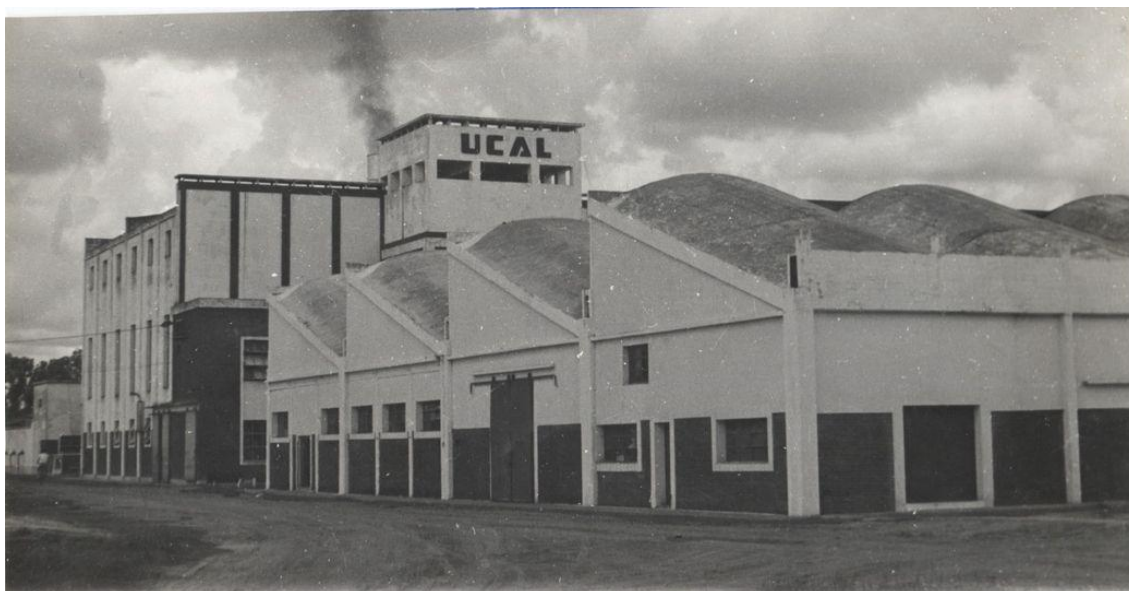
Imagen 3: Foto de la Ex FANDET, administrada por UCAL. (s/f)

Para el mes de agosto de 1962, casi un año después del traspaso, se iniciaron los problemas en FANDET Barranqueras (ver Imagen 3), por cuanto el stock de fibra comenzó a acumularse por problemas en su procesamiento; también se acrecentó el volumen de productos (bolsas de algodón, hilos, paños, etc.) sin vender y tampoco se realizaban de manera regular los cobros de lo ya entregado. Dentro de una amplia lista de problemas, se destacaban la falta de leña para mover las calderas que alimentaban gran parte de la maquinaria de la fábrica; el inicio del reemplazo de la bolsa de algodón por otro tipo de recipientes y los problemas macroeconómicos, referidos a la inflación. En este contexto, FANDET paralizó sus actividades por treinta días (“UCAL aclara...”, 1962).