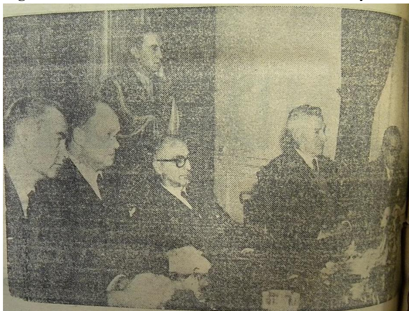
Imagen 2: Momento de la firma del decreto N°4065 mayo de 1961