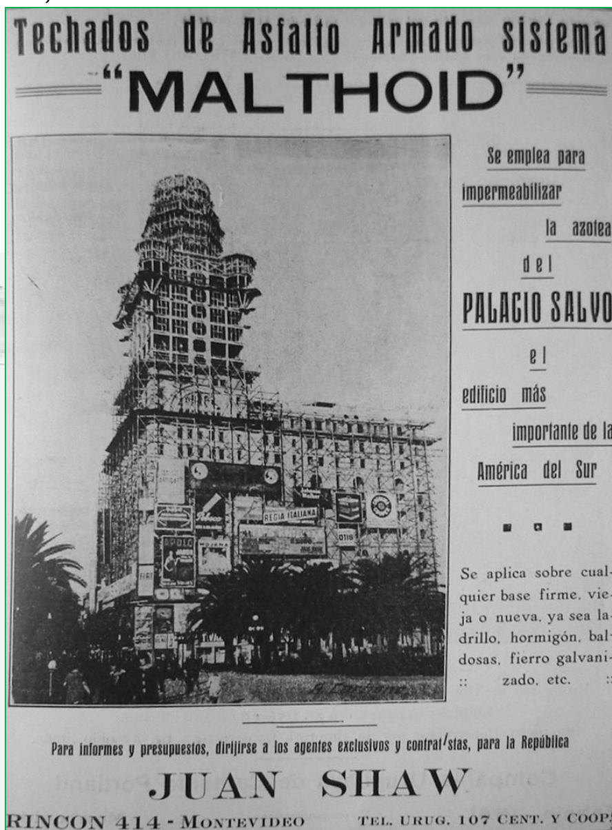
Imagen 6: Publicidad de materiales de construcción haciendo uso de la imagen del Palacio Salvo, 1925