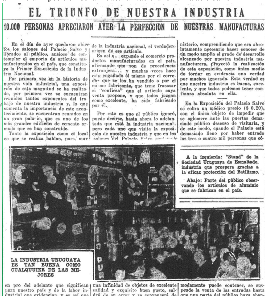
Imagen 7: “El triunfo de nuestra industria. 10.000 personas apreciaron ayer la perfección de nuestras manufacturas”, nota publicada con motivo de la inauguración de la Primera Exposición de la Industria Nacional en el Palacio Salvo