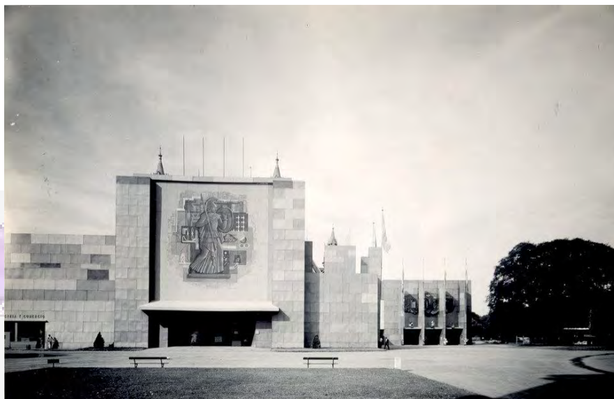
Figura 3: Exposición de la Industria Argentina, Mural de Alfredo Guido, 1946.