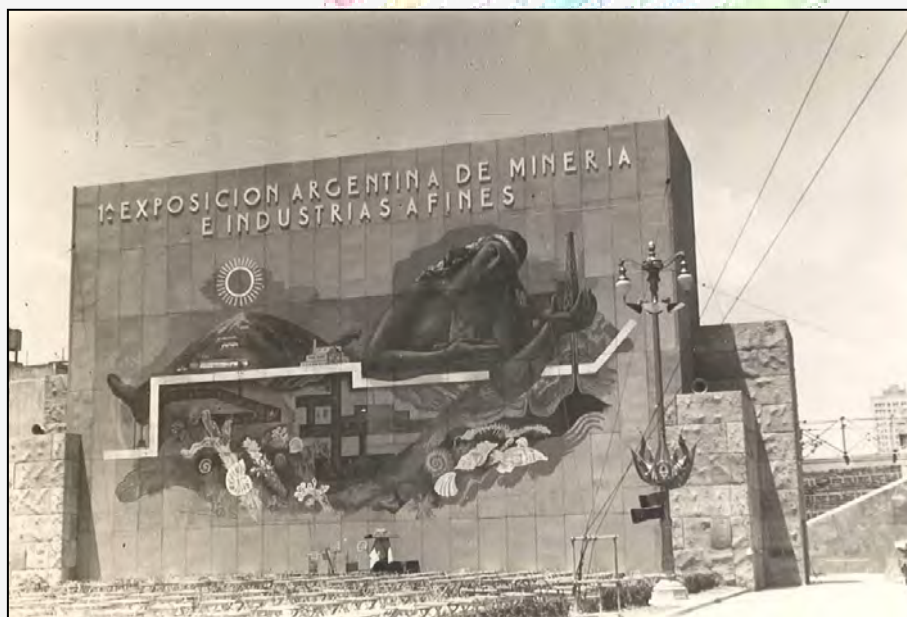
Figura 5: Mural de la Primera Exposición Argentina de Minería e Industrias Afines de Alfredo Guido.