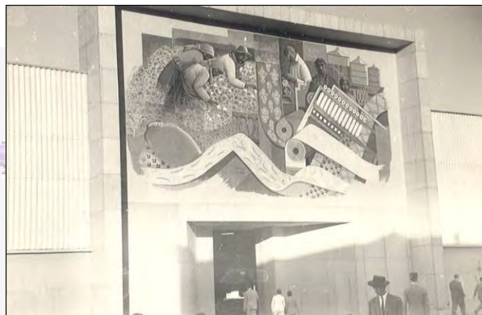
Figura 9: Alfredo Guido, Mural con el ciclo de los textiles.

en el hogar y la enfermera, aquí aparece la mujer trabajadora, en particular, la mujer cosechadora en los campos algodonereros, así como también la mujer hiladora (Figura 9 y 10). Si bien estas mujeres desarrollan roles tradicionalmente femeninos, no deja de representar un cuadro más complejo que el que surge del estudio de la gráfica peronista.