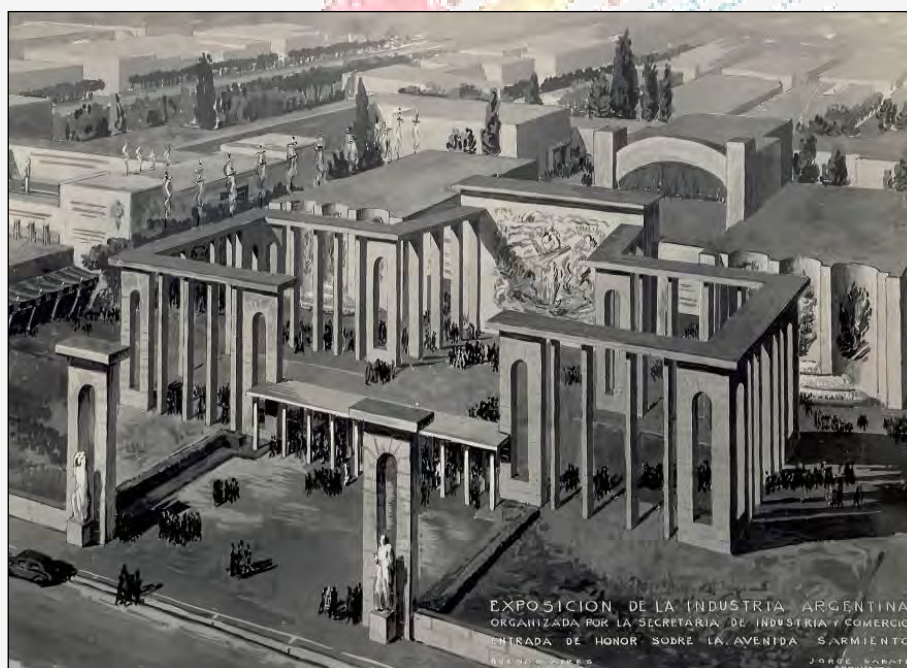
Figura 1: Vista realizada por el Arq. J. Sabaté de la Exposición de la Industria Argentina de 1946 realizada en el predio de la Sociedad Rural.

De acuerdo a lo que se observa en las fotografías, a estos eventos acudía una gran cantidad de público; se trataba de un espectáculo político donde se ponían en escena los logros sociales y económicos del nuevo régimen. En estas arquitecturas que eran habitadas temporalmente, ya que se abrían al público en forma libre y gratuita, se celebraban los éxitos y se hacía partícipes a las masas de los logros peronistas; se trataba de una celebración festiva que publicitaba la economía y la industria de aquellos años.