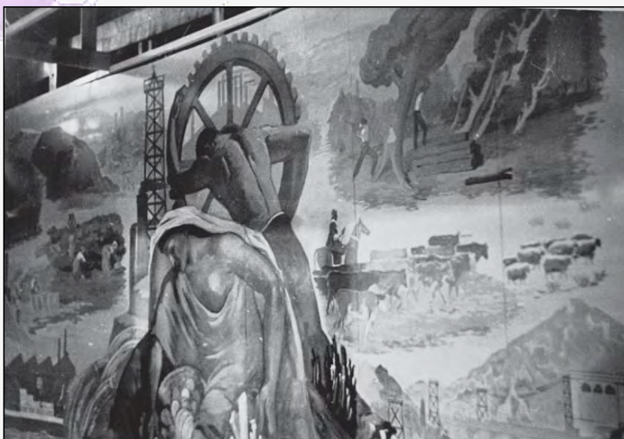
Figura 11: Dante Ortolani, boceto realizado para Exposición de la Industrias, s/fecha.

Fraternidad. Los pequeños fragmentos que componen el mural (gauchos, pareja de trabajadores, mujeres con canastas de frutos, campesinos, los silos, las chimeneas de las fábricas, los pozos petroleros, Manuel Belgrano y la escarapela, el Cabildo y el puerto) combinan imágenes nuevas y otras anteriores tomadas del mural de La Fraternidad. Se trata de tres hombres sosteniendo un círculo de acero, que en el caso del mural más tardío pende de un brazo de grúa y, en el de La Fraternidad, se encuentran girando una gran rueda, que parece ser el frente de una locomotora.