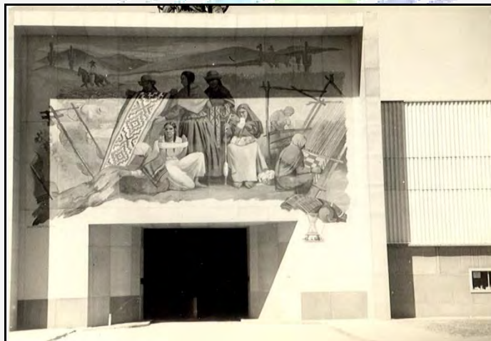
Figura 10: Dante Ortolani, Mural exterior sobre los textiles.