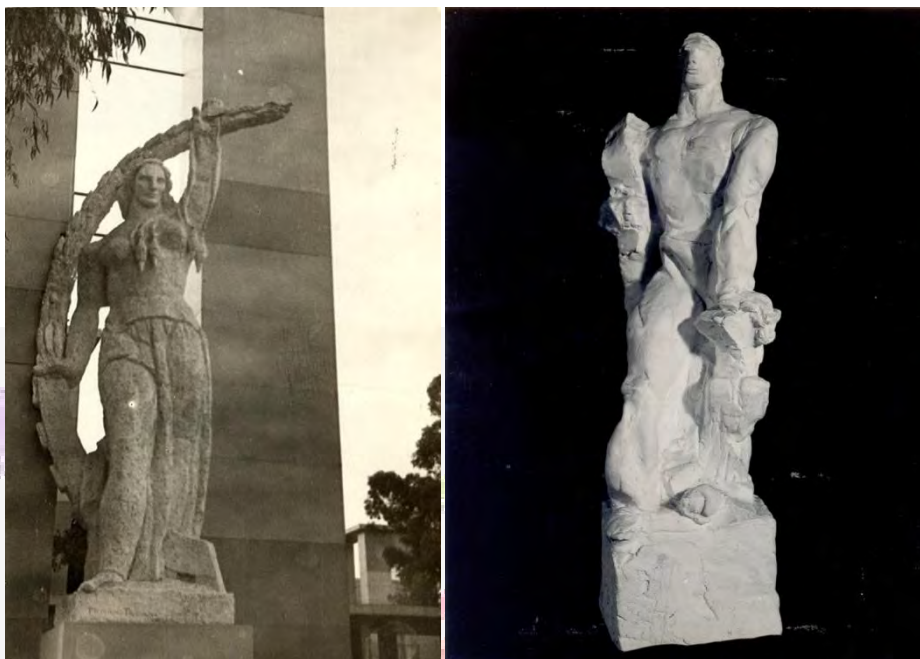
Figura 4: Fotografía de La Industria (izquierda) y maqueta de El trabajo , de Troiano Troiani.