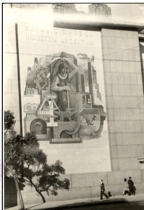
Figura 6: Mural de la Exposición de la Industria Argentina.