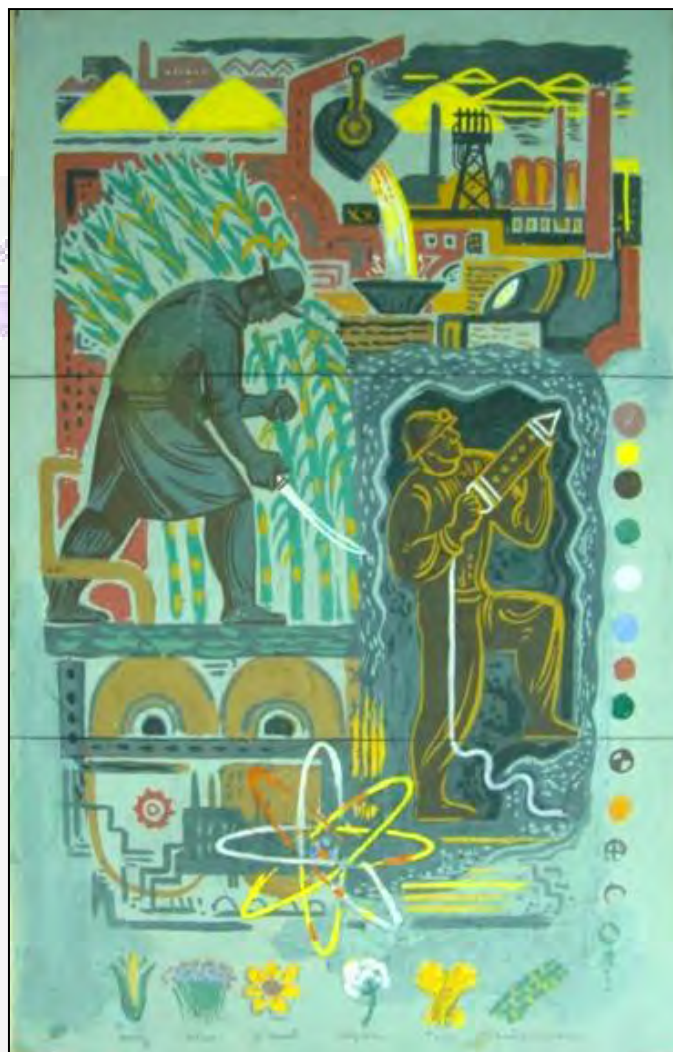
Figura 7: Alfredo Guido, Boceto Industrialización .

Tema: La Industria en General, por ser especial su ubicación debe tener el cometido de anunciador de la Exposición”. 32