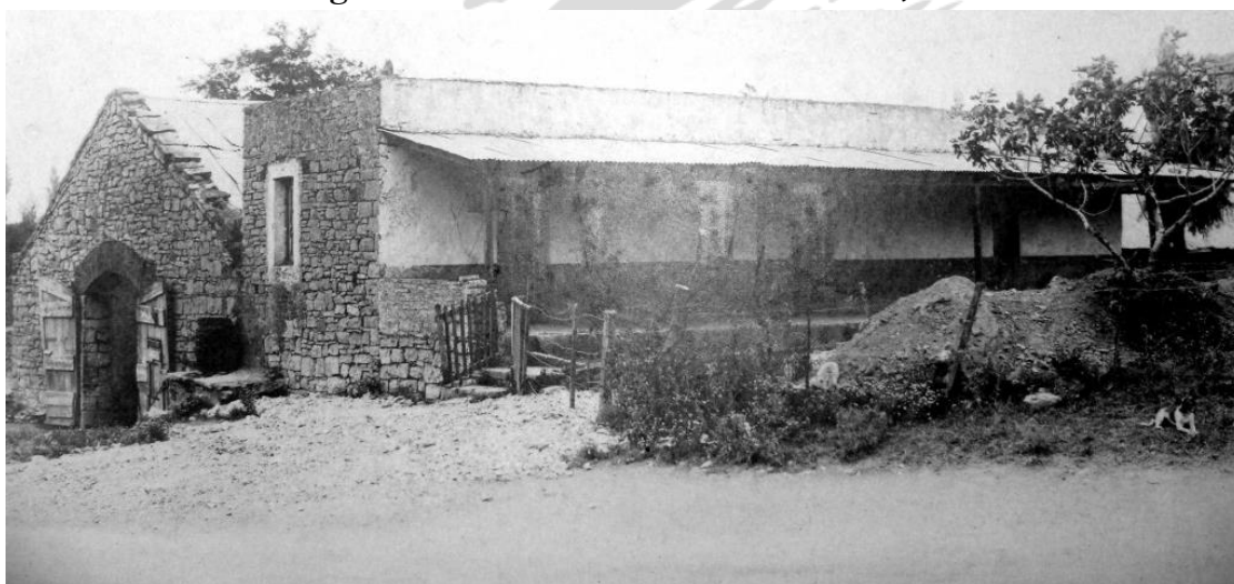
Imagen 2: Calera de don Manuel Mouriño, 1920