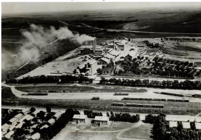
Imagen 2: Vista Aérea de la Compañía Argentina de Cemento Portland, 1983