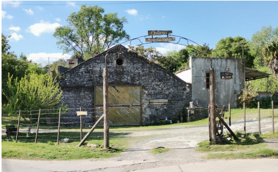
Imagen 3: La Calera 1888, 2023

que fueron útiles para conocer sobre la administración, su relación con otras caleras y la fábrica de cemento, etc.