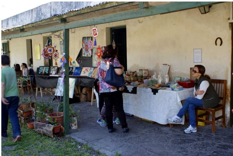
Imagen 6: Feria artesanal en la galería, 2016

En el año 2012 comenzaron las primeras actividades públicas en el espacio y una de las primeras propuestas en el espacio fueron las ferias artesanales, en su mayoría motivadas por emprendedoras locales que buscaban vender sus productos. Por lo que podemos afirmar que este grupo se constituyó como el primero en accionar, ocupar y refuncionalizar el espacio.