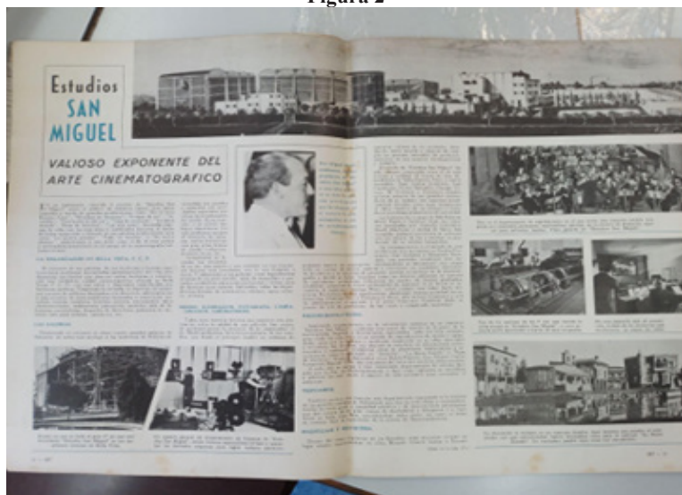
Figura 2. Nota sobre los Estudios San Miguel en Set. Revista cinematográfica argentina , diciembre de 1946. (Biblioteca Nacional Mariano Moreno- Hemeroteca)

La nota que recogemos aquí muestra, entonces, la relevancia de los ESM en su contexto, pero también la presencia fundamental del modelo de Hollywood expresada en la importación (para su adaptación y reformulación) tanto de sus tecnologías de producción y modos de hacer cine (económica y culturalmente) (Majumdar 2009) 9 , como de representar en la esfera pública (a través de los medios de comunicación gráficos y radiales) su propia dimensión industrial (Llorens, 2022). De esta manera, en el discurso y las fotografías de Set , ESM se observa en un lugar central con respecto al paradigma hegemónico de producción económica y cultural cinematográfica, y de estrategias de posicionamiento en la esfera pública. En el contexto argentino de las décadas de 1930 y 1940, en pleno auge de los estudios cinematográficos locales ( Lumiton -sobre todo en