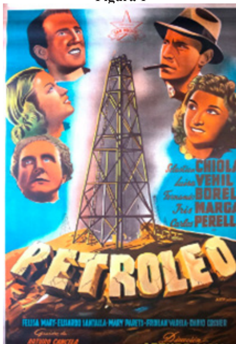
Figura 1. Afiche de Petróleo (dir. Arturo Mom, 1940), primer largometraje de Estudios San Miguel .

La empresa cinematográfica fue una de las más dinámicas y reconocidas del país y de América Latina entre 1940, año en que se estrena el primer largometraje de la productora, Petróleo , dirigida por Arturo Mom (Figura 1), y 1951, cuando la empresa entra en crisis y la productora deja de funcionar, alquilando los estudios a otras empresas del sector 8 . De esta posición dan cuenta las publicaciones periódicas dedicadas al mundo del