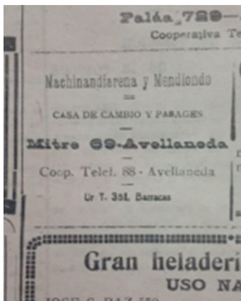
Figura 4. La Libertad , 3 de enero de 1919.

En el relato sobre “Don Miguel Machinandiarena” con motivo del décimo aniversario de los estudios, hay un vacío llamativo (sintomático) entre 1929, momento en el que, siguiendo el cálculo de los diez años desde la entrada como auxiliar, Machinandiarena habría llegado a ser gerente del Banco de Avellaneda, y 1937, cuando, siendo socio de la Unión Kursaal Argentina, junto con Silvestre Machinandiarena y Félix Solá (hijo de un importante empresario del juego, con concesiones de casinos en Avellaneda y Buenos Aires), Miguel participa de la licitación (que gana en enero de 1938) que el gobierno provincial de Manuel Fresco (la conexión con Alberto Barceló, intendente de Avellaneda, sugiere